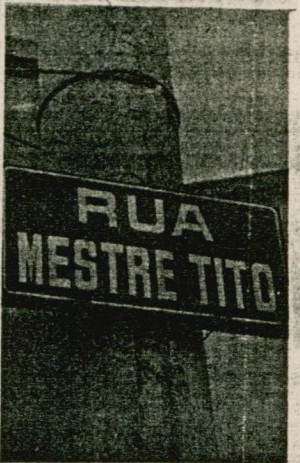
Rua Mestre Tito - uma travessa da Salles de Oliveira, ao lado do Teatro Castro Mendes.

de. Aguarda-se portanto a remoção de seus despojos para o local devido, medidas já estão sendo tomadas, e dias virão em que sua última vontade ainda será realizada.