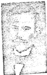
José Maria Latino Coelho

NO dia 29 de novembro de 1825 nasceu em Lisboa o escritor José Maria Latino Coelho, falecido em Sintra a 29 de agosto de 1891. Filho de um oficial de artilharia, seguiu também a carreira militar, escolhendo a arma de engenharia. Entrementes, foi lente na Escola Politecnica, vogal do conselho de instrução pública, secretario-geral da Academia Real das Ciencias e diretor do "Diario de Lisboa". Deputado ás cortes em varias legislaturas, foi ainda ministro da Marinha e Ultramar, no gabinete de 1868-1869. Colaborou em numerosos jornais, entre os quais "A Epoca", "O Farol", "A Emancipação", "Politica Liberal", "Revolução de Setembro". Conhecedor de muitos idiomas, traduziu para o português diversas obras classicas, inclusive "A Oração da Coroa", de Demostenes. Deixou publicadas, entre outras, as seguintes obras: "Curso de Introdução á Historia Natural dos Três Reinos", "Considerações Sobre a União Iberica", "Escritos Literarios e Politicos", "Historia Politica e Militar de Portugal Desde os Fins do Seculo XVIII até 1814" (3 volumes).