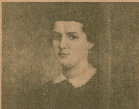
“Dama da Corte de D. Pedro II”, de Francisco Franco de Sá