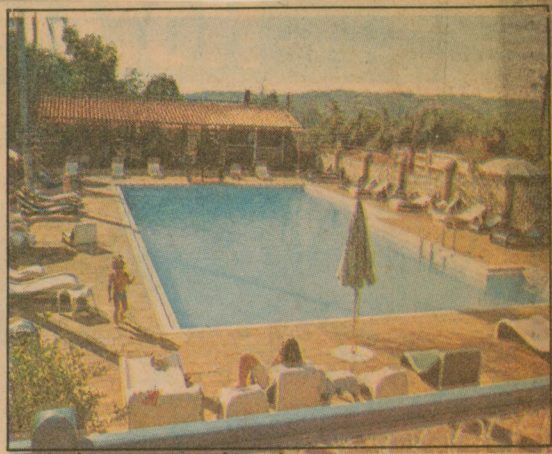
A piscina, sempre atraente