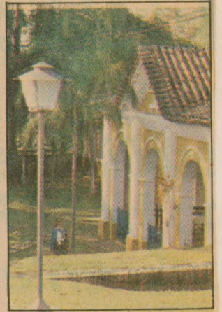
Uma visão do hotel