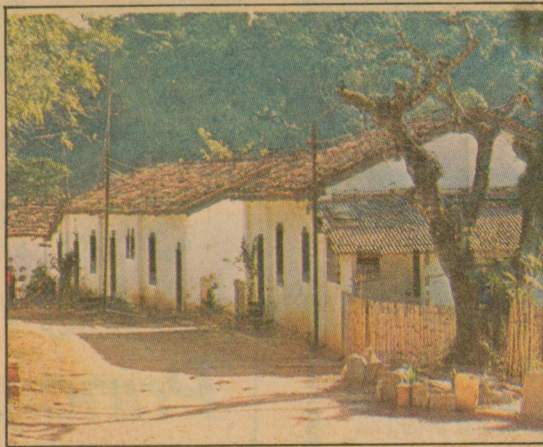
Aqui vivem os empregados