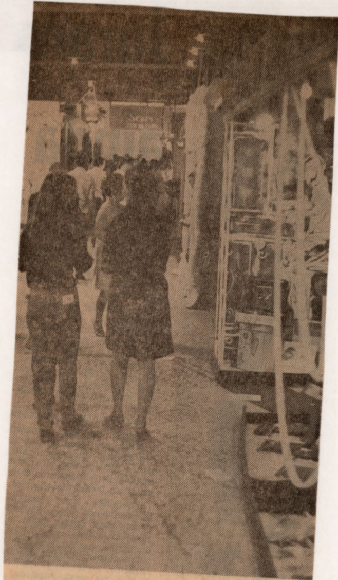
Da sucursal de Campinas FICAM mostra desde modas até aparelhos

REGRESSARÁ a Campinas os representantes dos condôminos do convênio de Porto Alegre. Diário de São Paulo, 22 mar. 1942.