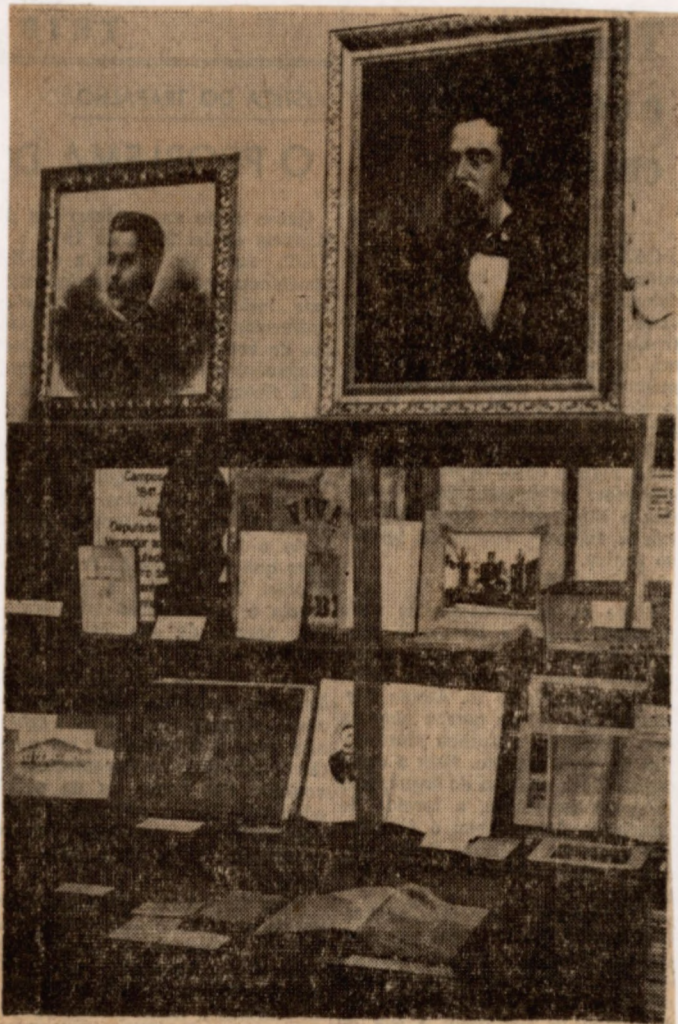
Livros, quadros, autografos: algumas das reliquias pertencentes ao Museu de Campos Salles.