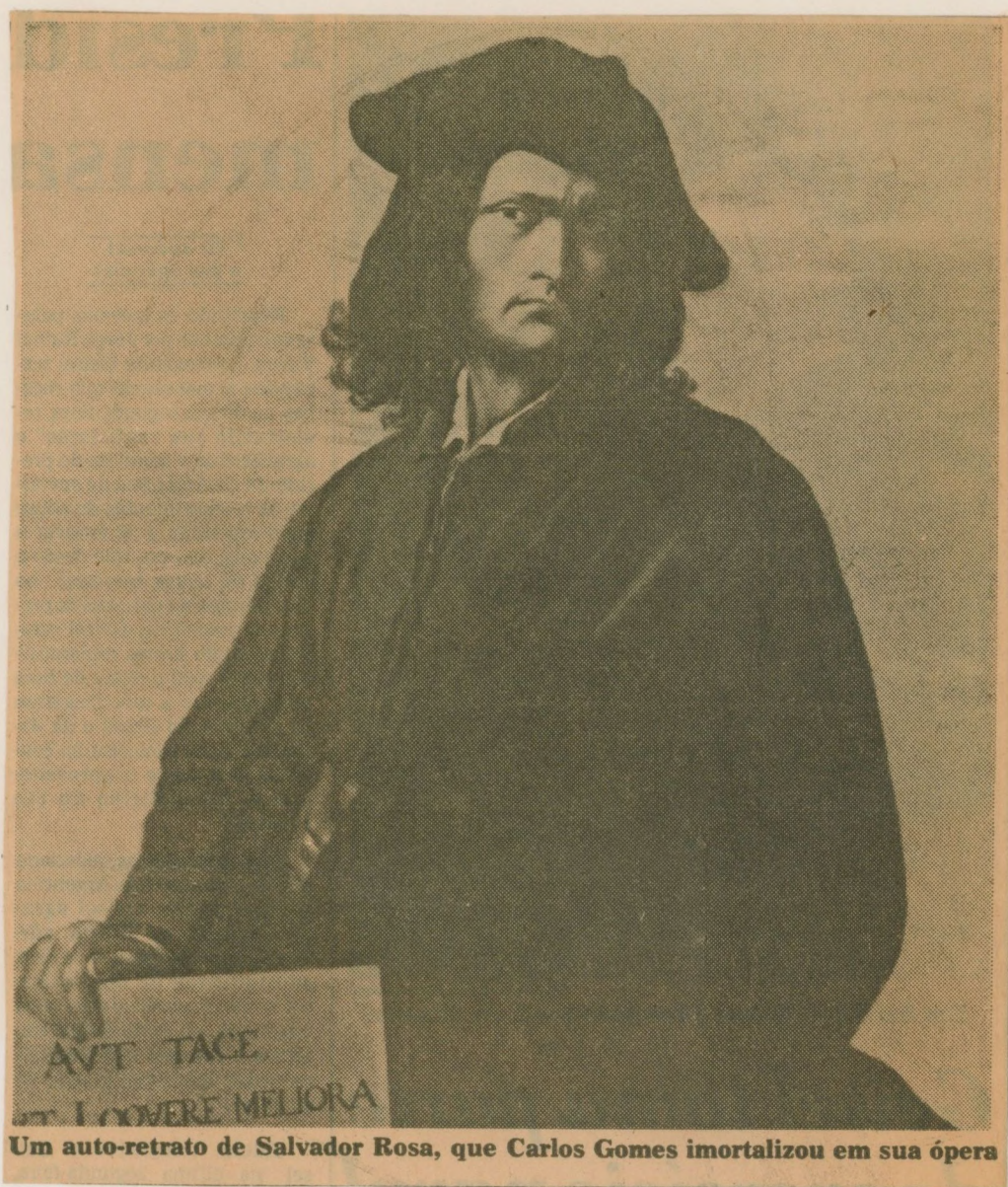
Um auto-retrato de Salvador Rosa, que Carlos Gomes imortalizou em sua ópera

Salvador Rosa volta ao palco do Municipal. O estado de São Paulo. São Paulo, 09 set. 1977.