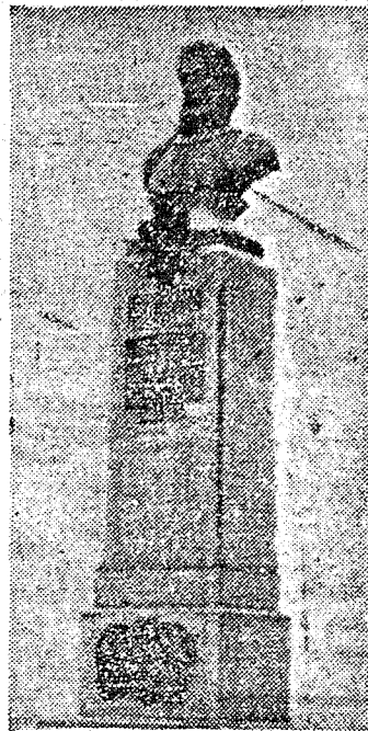
Busto de Camões, primoroso trabalho de José Rosada erigido no Jardim fronteiro à Beneficência Portuguesa

A escultura, um dos mais difíceis ramos das artes plásticas, cuja técnica requintada e vibrante dando formas ao mármore ao granito e ao bronze perpetua momentos de sublime inspiração artística, foi sempre pouco cultivada entre nós.