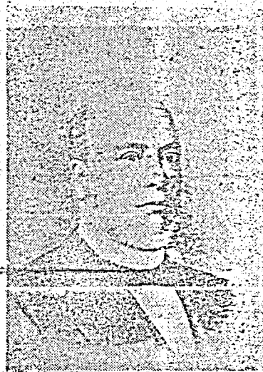
608 — Barão de Paranapanema