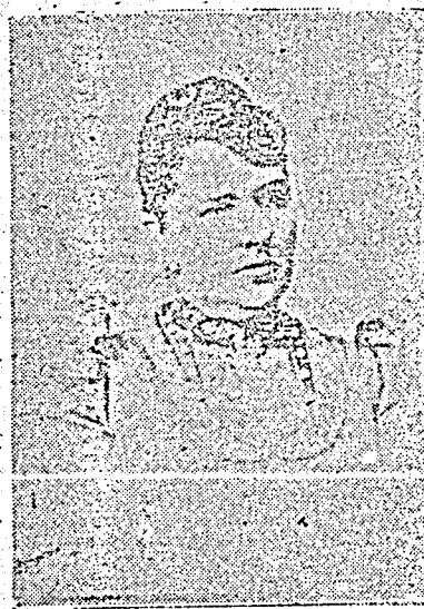
608 — Baroneza de Paranapanema