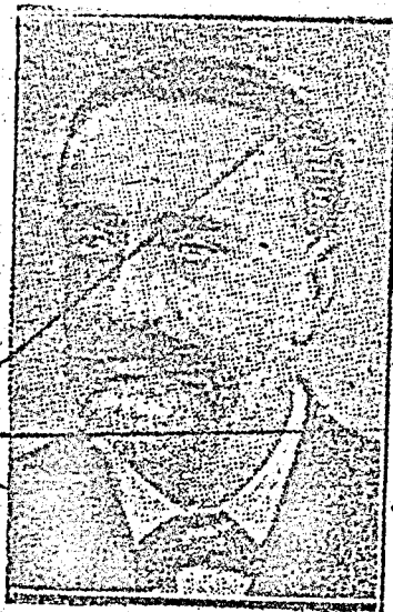
609 — Barão de Paranapiacaba