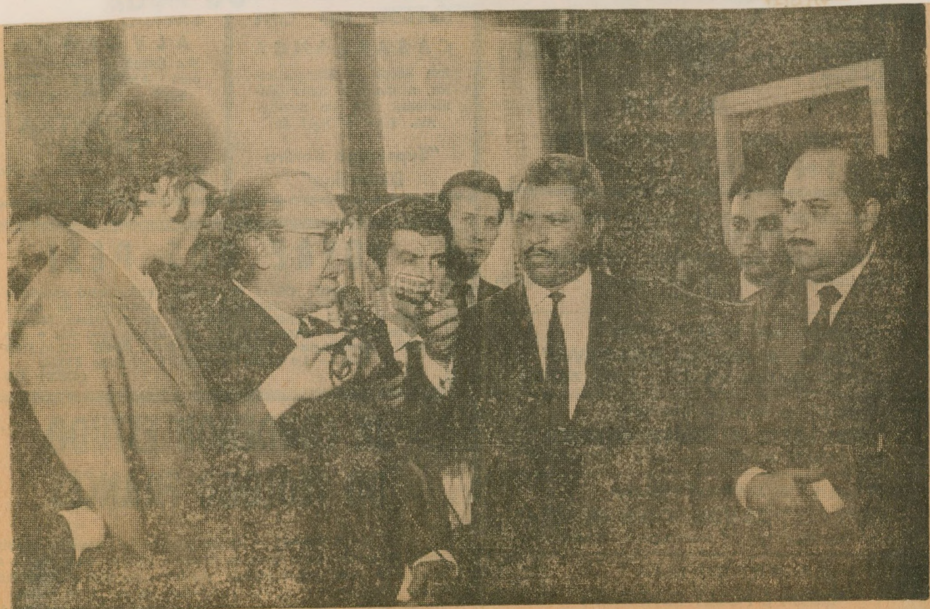
↑ O ministro Carlos Furtado de Simas fala. Diz que o responsável pelo ritmo dinâmico em seu Ministério é o presidente Costa e Silva, a quem chama de "homem simples trabalhando pelo Brasil". ↑