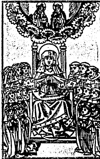
Santa Brígida no trono, em meio a sua família religiosa: xilogravura da edição "princeps das Revelações da santa" (1492), Lübek (Alemanha).

Corria o ano de 1302. Na igreja matriz de Birger, cidade da Suécia, o velho pároco terminava suas orações a altas horas da noite. Em determinado momento viu surgir diante de si, sentada numa luminosa nuvem, a Virgem Maria. "Nasceu hoje em Birger uma menina cuja voz admirável se estenderá por todo o mundo", disse-lhe a Mãe de Deus. Alguns dias depois o Príncipe Birger, Governador da Província de Upland, trazia, pela sétima vez, o fruto de seu enlace com a Princesa Ingeburge, para receber o Santo Batismo. A recém-nascida recebeu o nome de Brígida, e, elevada à honra dos altares, sua festa é comemorada no dia de hoje pela Igreja Universal.