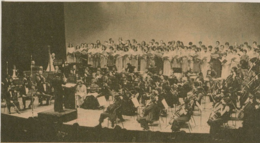
A Sinfônica campineira com salmo bíblico

Municipal de São Paulo, dia 18 último. A peça é de 1921, originalmente um drama do poeta René Morax, musicado depois por Honeger para instrumentos de sopro, contrabaixo, piano e harmônica. Estreou, na época, na pequena cidade suíça de Mazières. Recebeu, depois, roupagens de música de concerto, transformando-se no "Salmo Sinfônico". "O Rei David" recria musicalmente o espírito e a atmosfera bíblica do Velho Testamento através das mais variadas fontes estilísticas: contraponto Handeliano, corais de Bach, melodias diatônicas, folclóricas, música oriental e exótica e politonalidade.