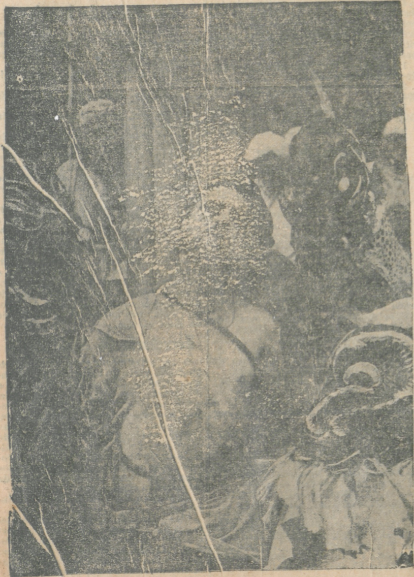
Uma das cenas mais impressionantes de "Miguel Strogoff"

Essa legítima maravilha, que está encantando o público carioca e daqui a poucos dias virá empolgar a plateia do Sant'Anna, merece a mais estrondosa reclamação. É factó muito natural, o de recomendar-se e mesmo de se fazer questão de que os outros vejam e se deliciem com uma coisa que vimos e achamos esplêndida; eis porque se faz uma grande propaganda dessa película extraordinária, que é "Miguel Strogoff". Com sinceridade, afirmamos que se trata de uma invejável história de amor, intrigas, aventuras e lutas, que empolgará e encantará grandemente a milhões de corações. É uma narrativa forte, encerrando em si indomita coragem, muito temor e veneno de hipocrisia. Como montagem é surpreendente, como interpretação é impecável. Para melhor segurança da nossa opinião, basta citar o que desse film gigantesco disse a crítica da imprensa new-yorkina.