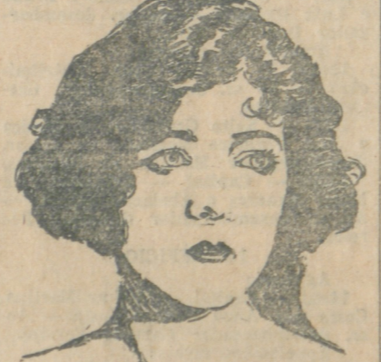
"Terra de todos". É uma produçáo da Metro Goldwyn Mayer, adaptada de um romance do conhecido escriptor hespanhol Blasco Ibanez, a quem mul-

O conhecido cinema do largo de São Paulo exhibirá hoje o excellent film de Antonio Moreno e Greta Garbo,