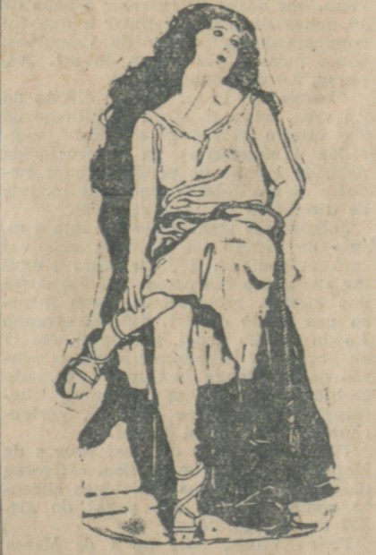
Patsy Ruth Miller, no papel de "Esmeralda"

"O CORCUNDA DE NOTRE DAME" NO THEATRO SANT'ANNA A apresentacão da nova edição do "Corcunda de Notre Dame" no theatro Sant'Anna, assumiu á importancia das grandes "premieres". Um publico selecto e numerozo encheu o salão do Sant'Anna. O film, não obstante ter transcorrido quasi dois annos após sua apresentacão, tem uma technica forte, uma interpretação impecavel e uma "mise-scène" majestosa. E' um desses films que podem desafiar o tempo e por muitos annos continuará sendo uma das mais perfectas produções do "cran".