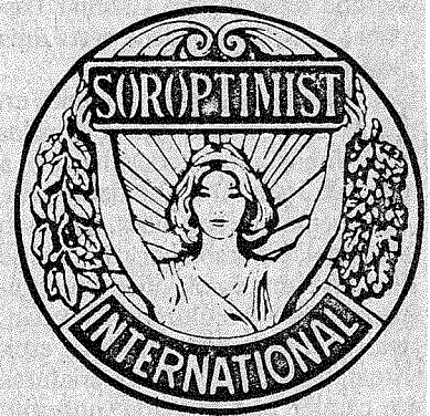
Emblema: conhecido no mundo