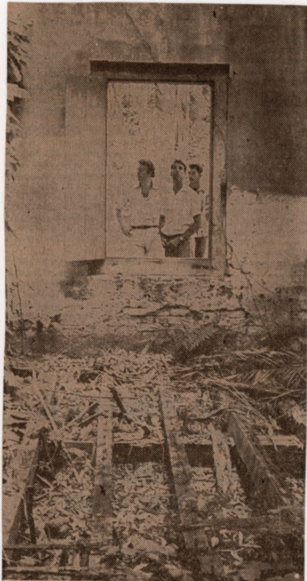
Da Sucursal de Campinas