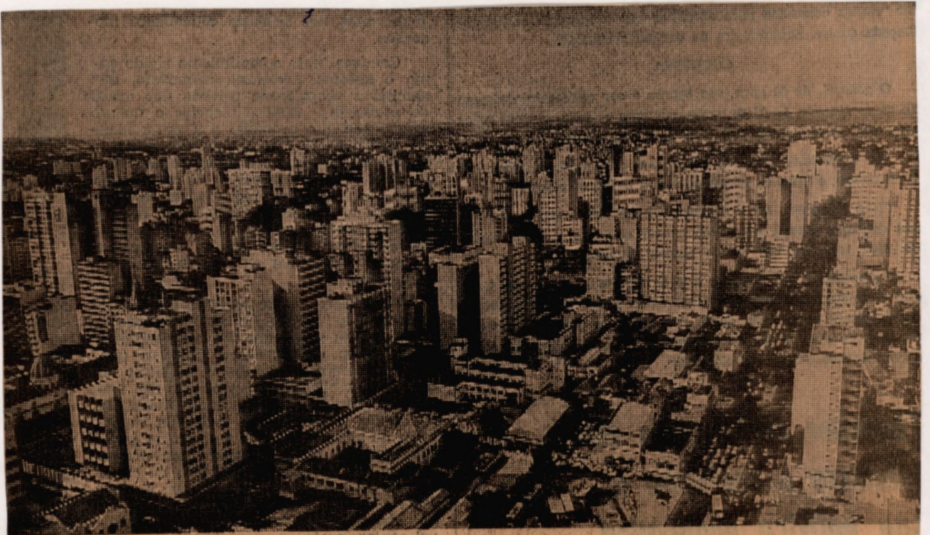
Pouco restará para as obras e serviços para uma cidade do porte de Campinas.

CRS II, bilhões, o dobro deste ano; maior parte do orçamento de 83 para os esvaziados. Curso Popular Campinas, 16 set. 1981.