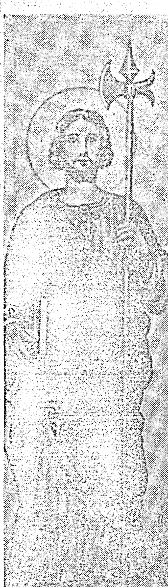
SÃO JUDAS TADEU

Simão natural de Caná, pertencente à tribo de Neftali ou Jabulon, aparece nos Atos dos Apóstolos com o título honroso de Zelador (Zelotes). Outros o identificam com Natae (os Gregos, os Coptas e Etiopes) ou até com o espóso nas bodas de Caná. Não deve ser confundido com o Apóstolo São Simão, parente de Nosso Senhor.