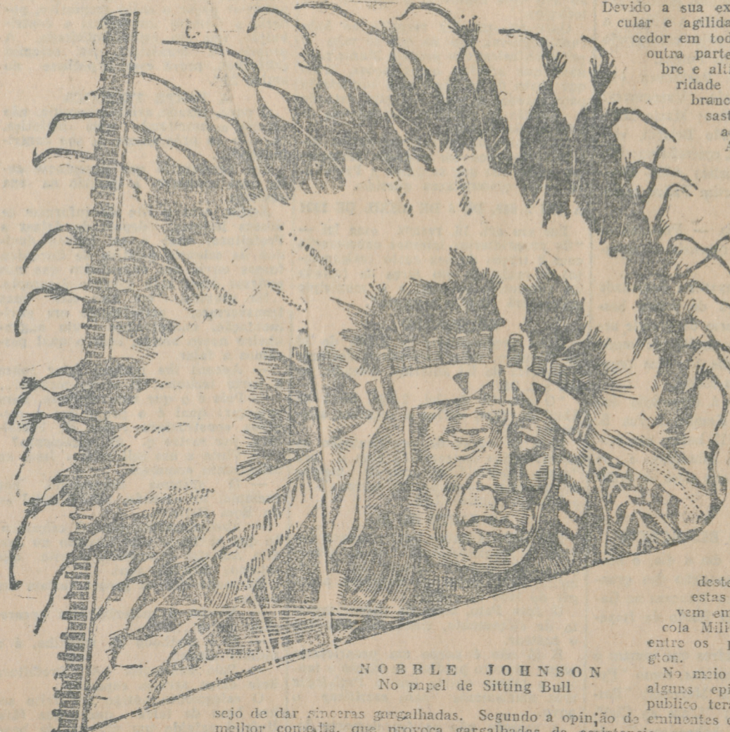
NOBBLE JOHNSON No papel de Sitting Bull

Intrepido guerreiro, enfrentava impavido os mais ferozes inimigos e frequentemente empenhou-se em duels com homens brancos e vermelhos. Devido a sua excepcional força muscular e agilidade, foi sempre vencedor em todos os encontros. Por outra parte o seu caracter nobre e altivo, creou-lhe popularidade entre os proprios brancos, mas depois do desastre de Little Big Horn as forças da União Americana receberam ordens para captural-o vivo, ou morto para infligir-lhe um severo castigo pelo massacre que elle permitiu fosse commetido com os prisioneiros e feridos da columna do general Custer.