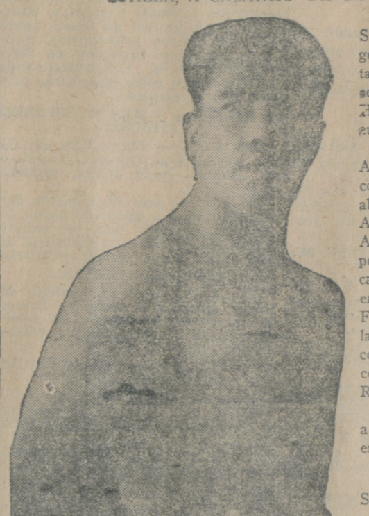
O boxador Spalla, ex-campeão da Europa

Passa hoje pelo porto de Santos, em transito para a Argentina, o vapor "Duca d'Aosta", que traz da Europa, entre seus passageiros, o boxador Herminio Spalla, ex-campeão europeu dos maximos.