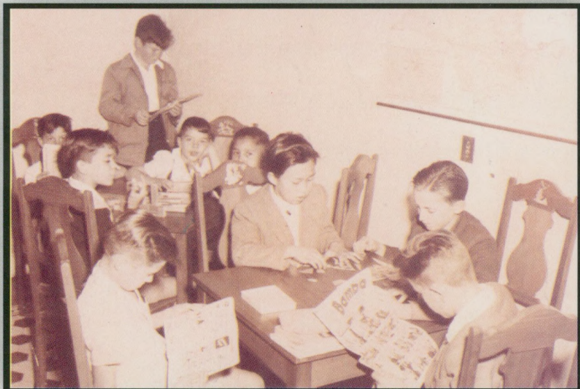
1960 - Bibliotecárias Local: R. Dr. Quirino com Marechal Deodoro