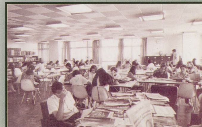
1970 - Leituras e Pesquisa