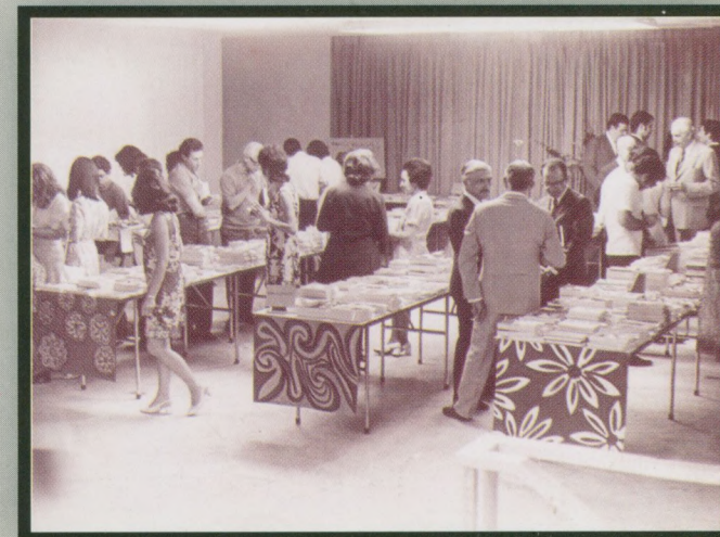
1970 - 7ª Feira do Livro Paço Municipal