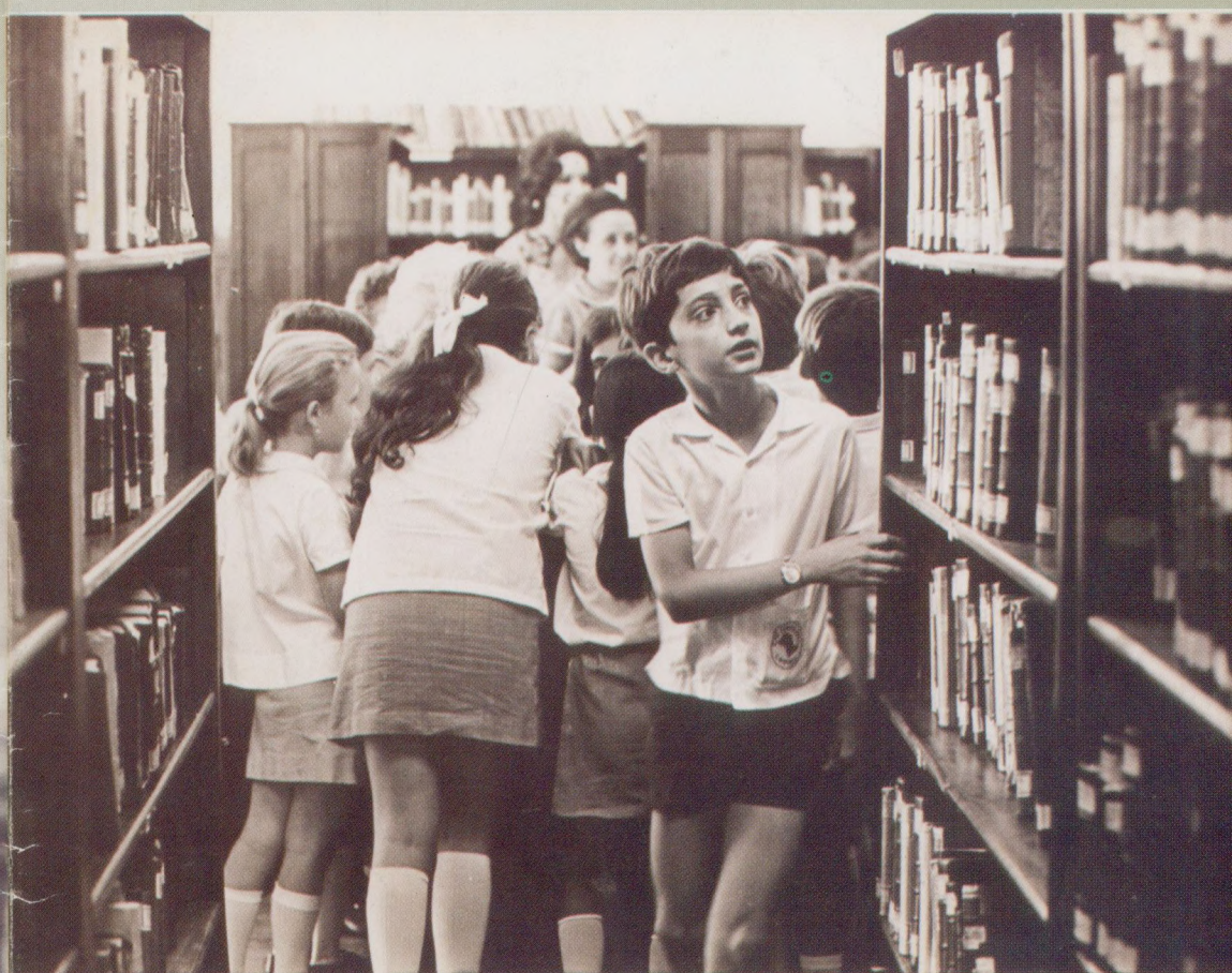
1971 - Alunos de 3ª e 4ª séries do Instituto de Educação Carlos Gomes em atividades na Biblioteca