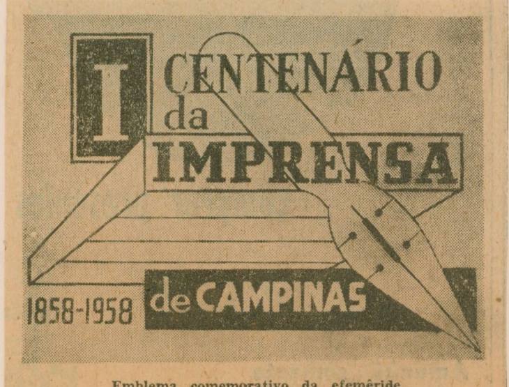
Emblema comemorativo da efeméride

Aos jornais do Brasil as nossas sinceras homenagens. Aos companheiros de luta, soldados do mesmo ideal, o nosso apertado abraço — que mandamos, de trincheira a trincheira, de Norte a Sul de nossa estremeçada Pátria: — a todos levando esta mensagem fraterna e afetiva."