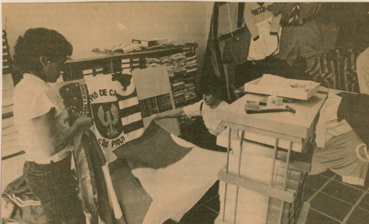
Guardinha montou loja para vender no restaurante municipal

LOJA no restaurante municipal: guardinha venderá confecções, a partir de amanhã. Correio Popular , Campinas, 21 dez. 1986.