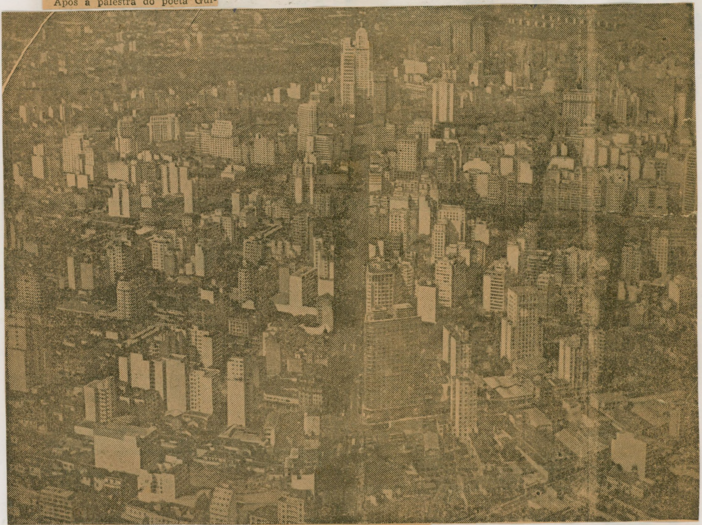
VISTA AEREA DE S. PAULO

Como nas demais noites já efetuadas, para a solenidade de amanhã a Comissão Organizadora do "Mês de Piratininga" não procedeu a distribuição de convites especiais, sendo franco o ingresso no recinto do Teatro Municipal de todas as pessoas interessadas em prestigiar essa iniciativa do Rotary Clube, que contou com o patrocínio da Prefeitura Municipal.