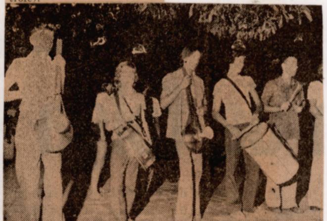
A Escola ensaia com afinco, pois quer representar bem Sousa no desfile do Bi