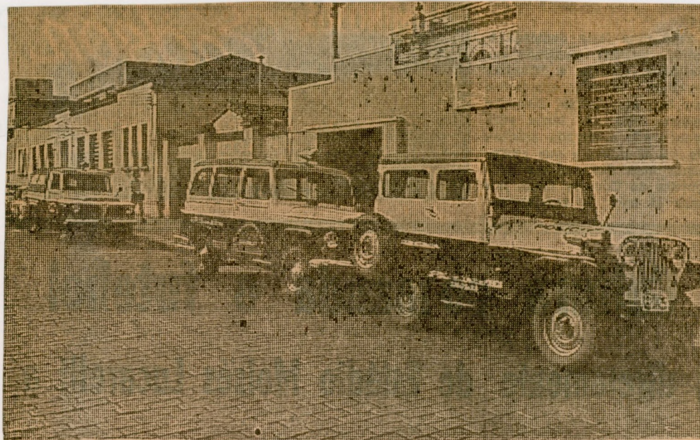
A sede da Guarda Noturna com as suas viaturas, quando Guilherme Campos assumiu o comando desta entidade