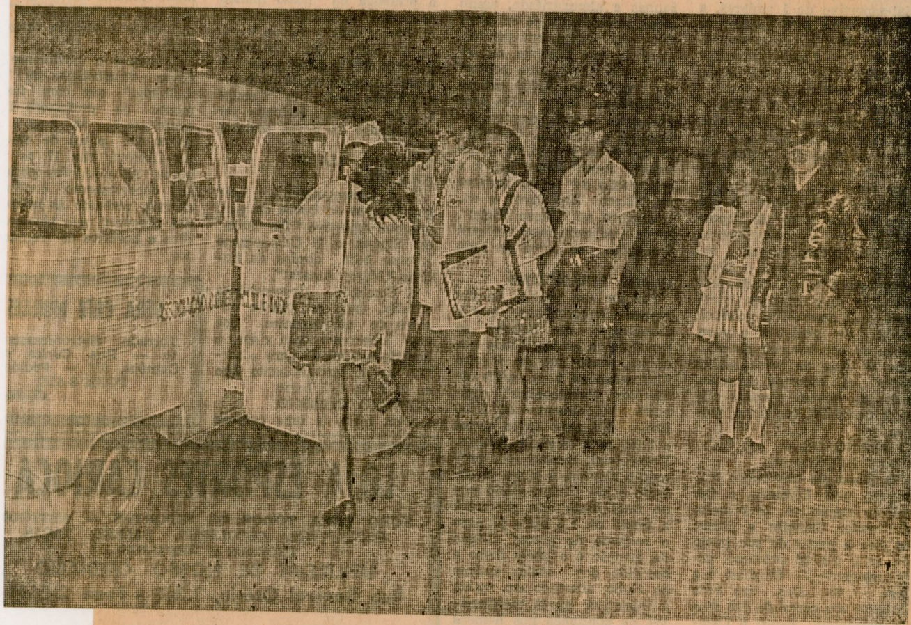
Transportar escolares um outro campo de atividade da Guarda Noturna