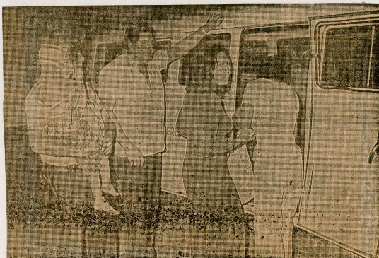
Assistência humana tem sido o ponto nobre da GN que atende a mais de 10 solicitações diárias