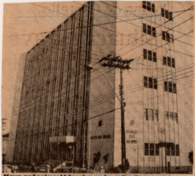
Nova agência está funcionando no Bonfim