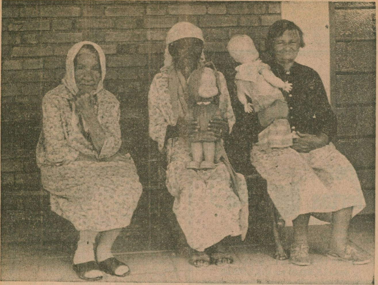
Retorno à Infância