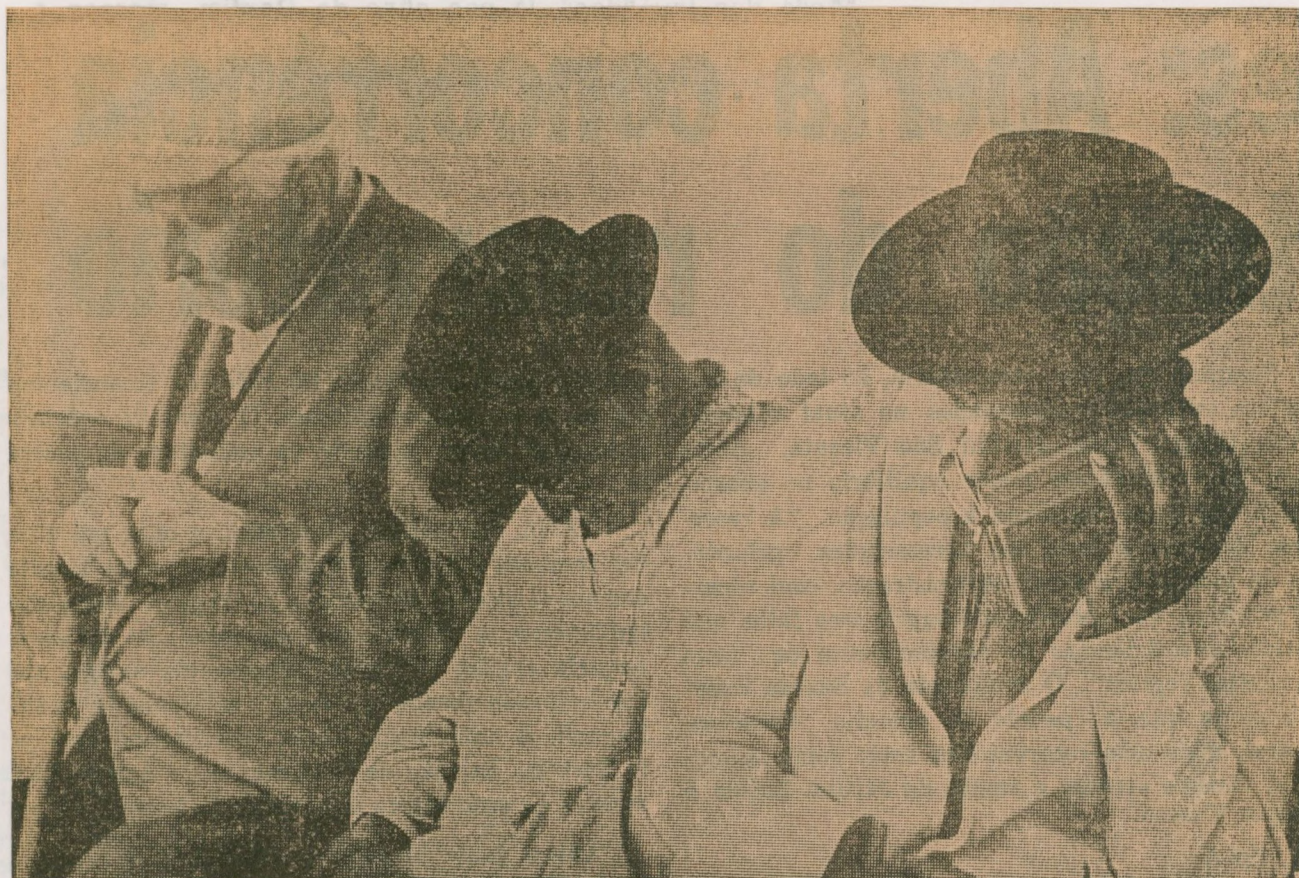
Sesta no Terraço