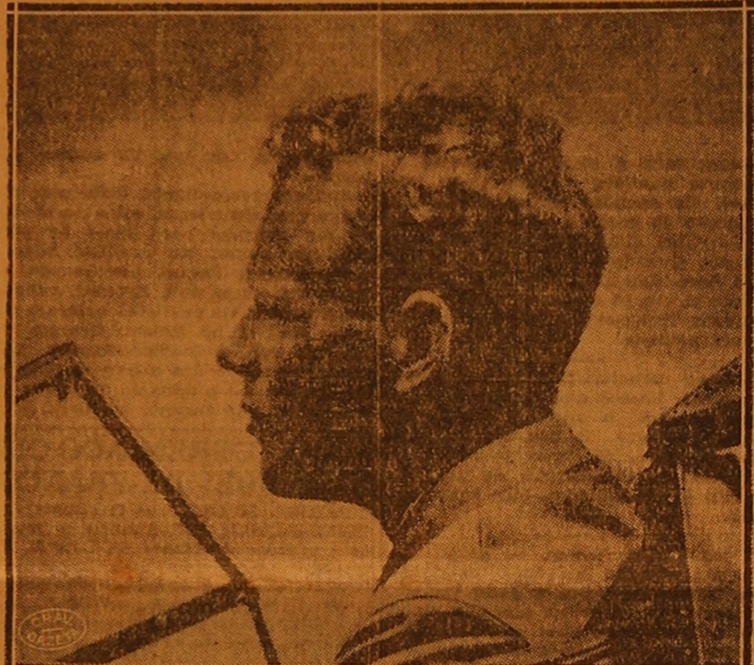
Carlos Lindbergh, o grande navegador norte-americano que, hontem, desceu nos Açores em optimas condições. Para onde irá agora, o heroico vencedor do "Espírito de São Luiz"?

O grande "az" Lindbergh desceu em optimas condições nos Açores — Para onde irá agora o heroe do "Espírito de São Luiz"? — Settle não bateu o recorde dos russos — Outros telegrammas