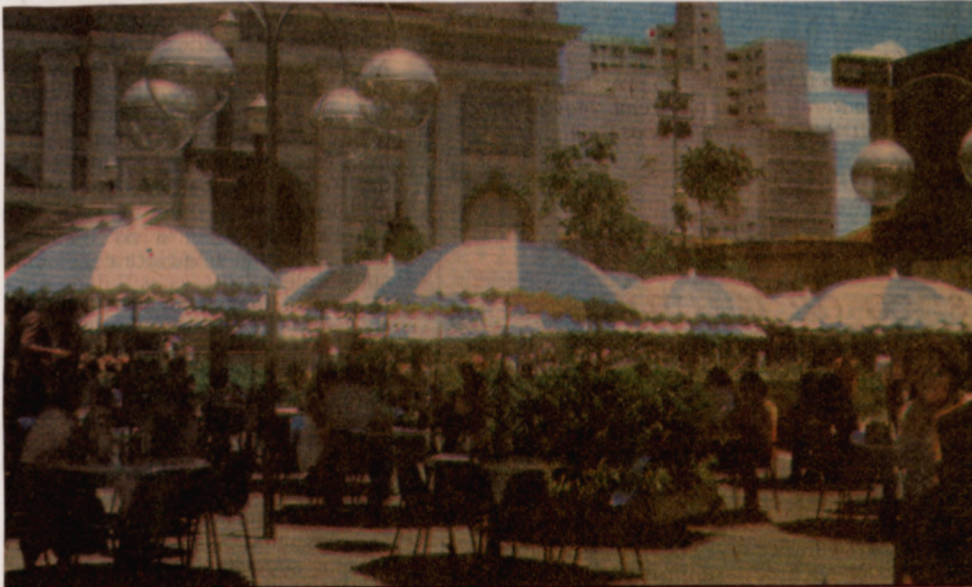
Defronte à catedral, o Convívio, onde tudo contribui para a gente sentir-se bem.