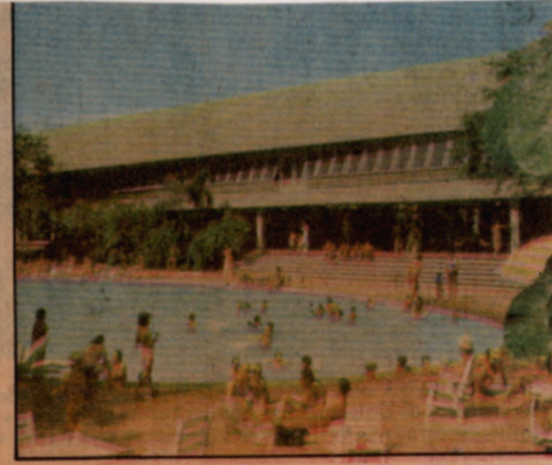
Bosque dos Jequitibás, dois alqueires de mata seleccionada, onde está o Museu de História Natural; a piscina do TC sempre aquecida pela juventude.

Biblioteca Centro de Memoria - UNICAMP CMUHE030583