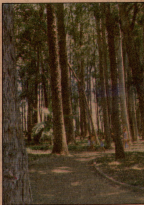
No Parque do Taquaral, os eucaliptos protegem com agradável sombra.

Nos clubes, a situação do Carnaval será assim: