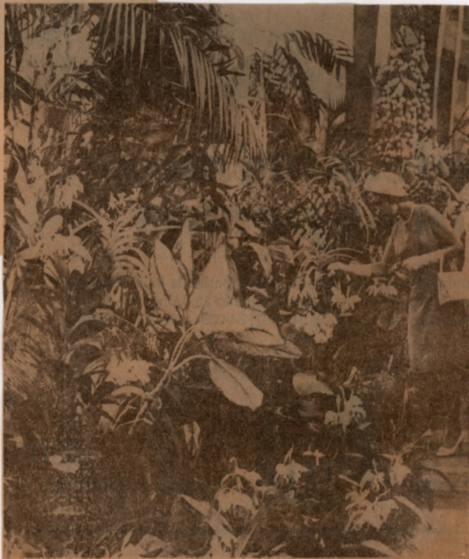
Em Campinas, a Rainha esteve no meio de flôres e plantas