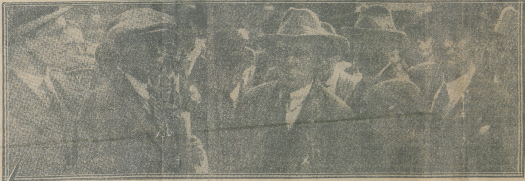
O SR. COOR (X) E OUTROS REPRESENTANTES DO "COMITE" DE MINEIROS, SEGUINDO PARA UMA REUNIAO DE CONCERTO DE ACCORDOS, COM O GOVERNO BALDWIN, DEPOIS DE CENTO E ONZE DIAS DE GREVE DOS MINEIROS DE CARVÃO.