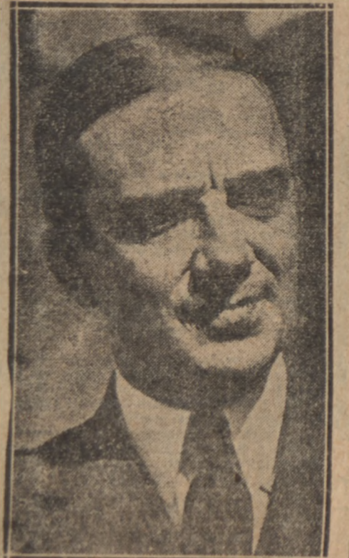
O Sr. Owen-Young

PARIS, 30 (Havas) — No accordo a que chegaram hontem os peritos das Reparaciones em relação ao Plano Young, ficou estabelecido