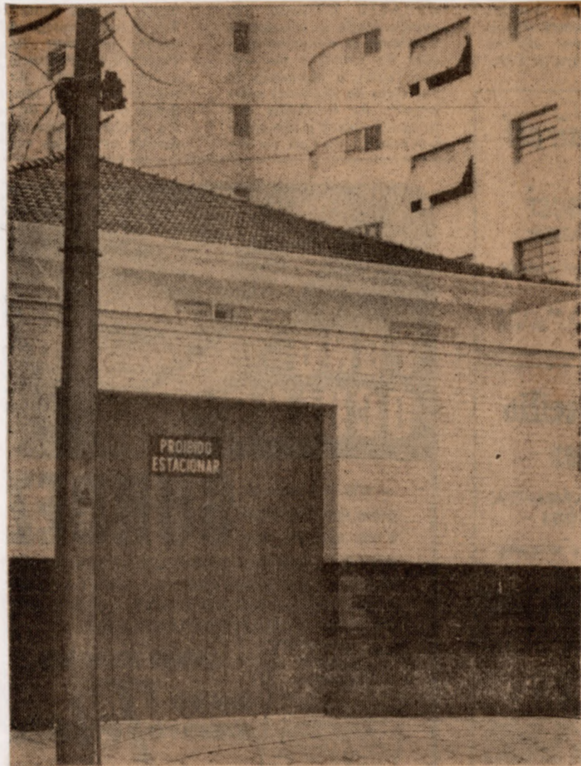
Não querem nada com quem passa na rua