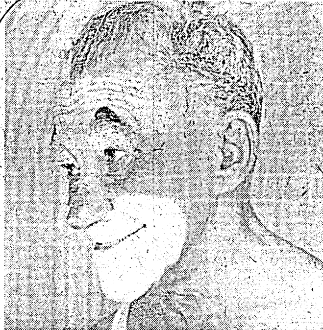
O Piolim feliz: seu rosto estava pintado